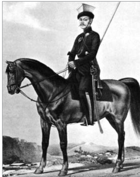
французов и их союзников.

Великий писатель Лев Толстой писал: «Завлечение Наполеона в глубь России произошло не по чьему-то плану, а в силу...», не зная о существовании плана, либо умышленно скрывая это. Как видим, план был, и имел под собой реальную основу. Александр I игрался с великим полководцем Наполеоном как кошка с мышкой. Французы так и не смогли взять Ригу, продвинуться в сторону Петербурга, а под Бородино получили такой удар, что вынуждены были остановиться. Однако план царя продолжал действовать, и Кутузов отошёл за Москву, впусив в неё