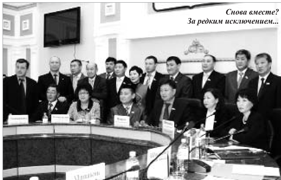
Снова вместе? За редким исключением...

Кстати, «ЭК» ранее писал, что стороны-противники возможность до-