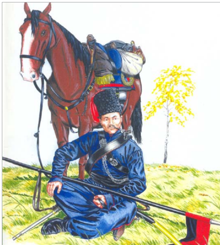
Калмык Ставропольского полка. 1812 г.